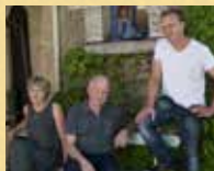
Domaine Thomas et fils Sancerre