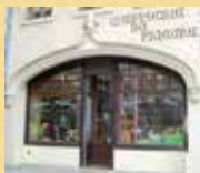
Confiserie du Prieuré