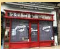
Le Bouchon de Loire