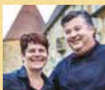
La Cerise sur le Cochon